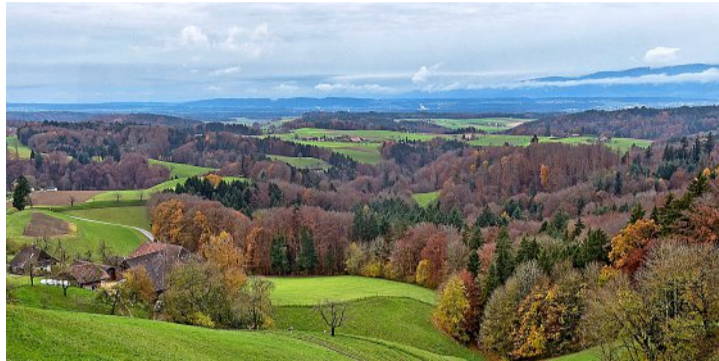
Schöne Aussicht von Ochlenberg Richtung Jura.

In 45 der 86 Gemeinden kamen weniger als 3,3 Erwerbs-